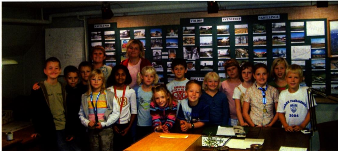
3.A fra Hyllehøjsskolen på besøg i Arkivet 2006.