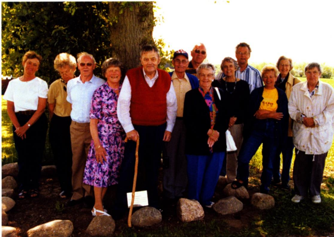
Opsætning af skilt ved Kvindeegen, Koesmosevej 74, Kauslunde, 1999.