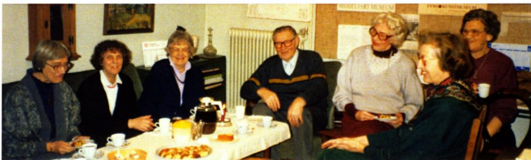
I Arkivets kælder 1992.