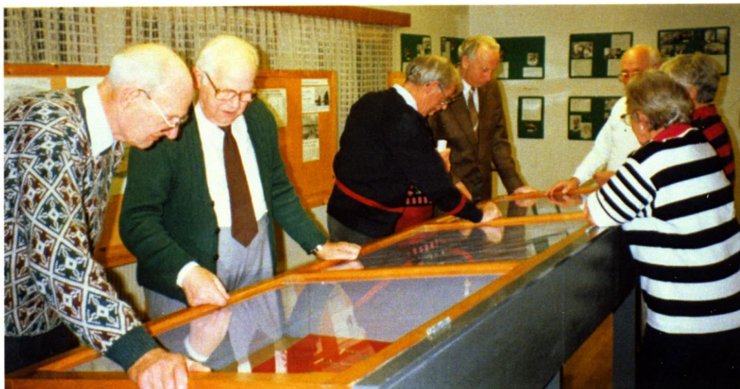
Gæster i Kauslunde-Gamborg lokalhistoriske Arkiv, 1992.