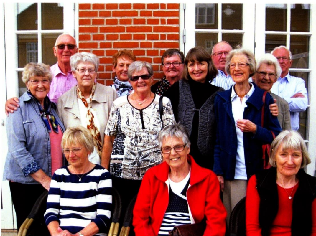
Arkivets medarbejdere fotograferet på Park Hotel 2012.