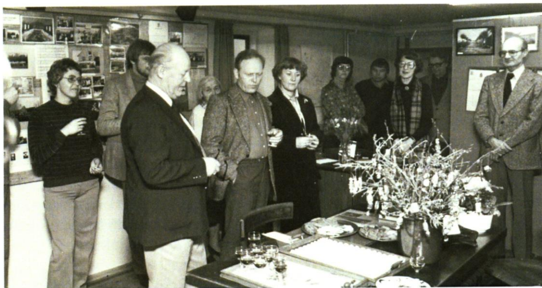
Indvielsen af Arkivet 1. marts 1981.

Det første bestyrelsesmøde afholdtes i Hyllehøj d. 13. januar 1981. Inden arkivets åbning d. 1. marts 1981 var der hektisk aktivitet. Der blev malet, opsat hylder, udstillingstavler og skabe, installeret el-stik, lys og spotlamper samt lavet udstilling. Alt skulle være billigst muligt, helst gratis, for økonomien var stram. Da den store dag endelig oprandt, kom der heldigvis mange på besøg. Vi fik gaver i form af penge og værdifulde arkivalier.