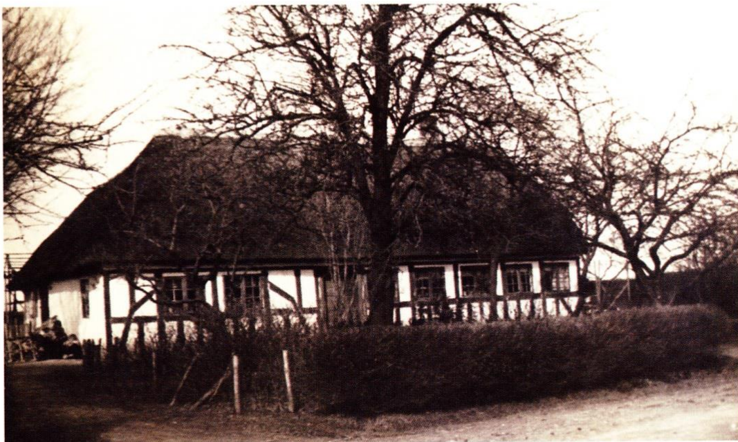
Kauslundevej 14, Kauslunde 1940erne.