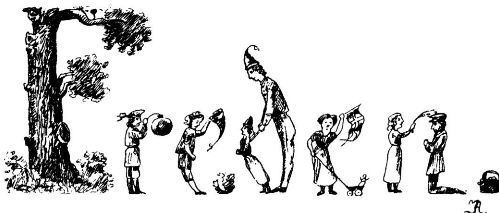
Frise tegnet af Johan Andersen.

Der udspandt sig følgende ordskifte, idet Johan steg på cyklen: Johannes:” Hør maler! Den sorte streg er skæv” - Johan:” Den trækker sig, når den bliver tør”. Og så var han cyklet.