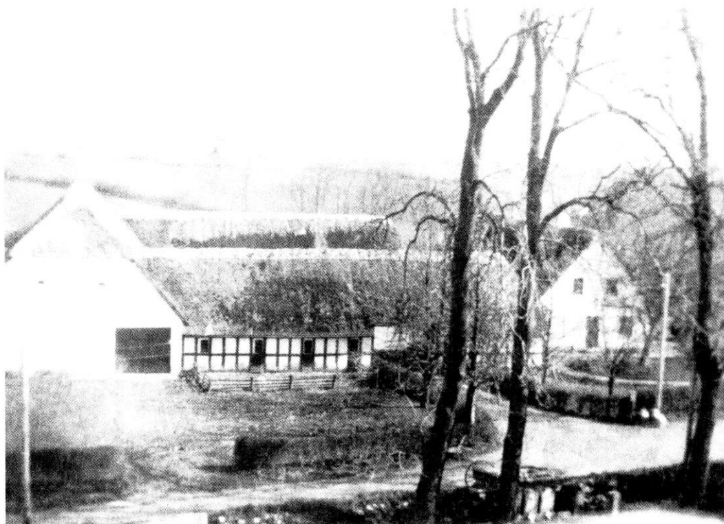
Eskedal ca. 1920.

Hun gik på stranden og bad til Gud om at få sin mand at se død eller levende, men der opstod den tanke, at husmanden havde skubbet ham i vandet. Vished herfor fik man ikke, men husmanden fik en tærende sygdom og døde ret hurtigt derefter. Man sagde, det var Guds straf.