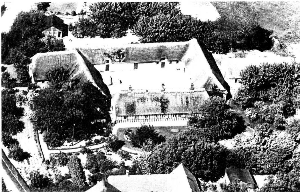
Skrillingevej 6 før 1952.

Hun var opvokset under trange kår. Som barn måtte hun følge med i marken for at drive på det forreste spand heste under markarbejdet. Dette foregik ofte på bare fødder, da de ikke havde råd til at købe træsko. Da hun blev lidt ældre, måtte hun med på hovarbejde på Wedellsborg, og det var både at læsse og sprede møg samt meget andet. I 14 dage var hun sammen med anden ungdom fra Gamborg på Brandsø for at skære tørv til herskabet. I de 2 uger sov de unge mennesker sammen i en lade på en af de to gårde på Brandsø. Om efteråret skulle de også flå ål. Det kunne hænde, at en af konerne skjulte en ål under skørterne, når de forlod arbejdet.