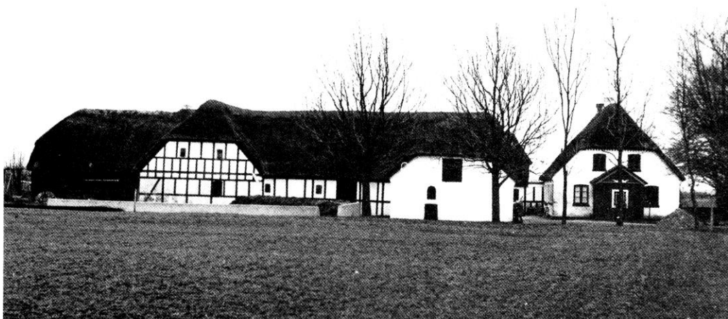
Hjørnegård ca. 1925.