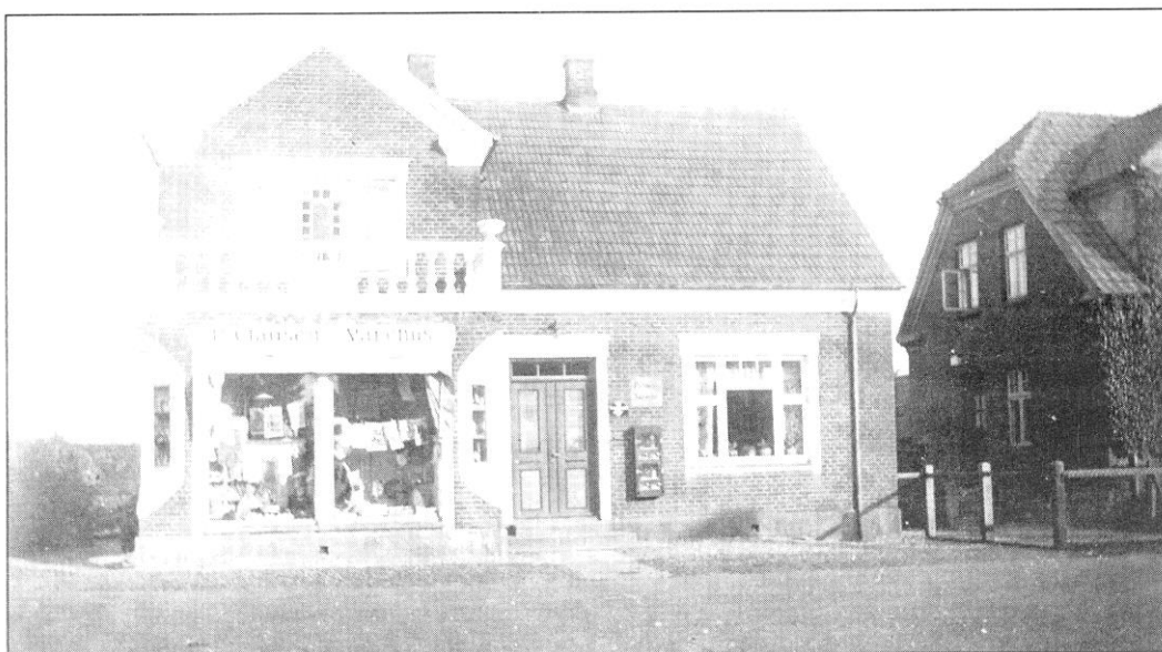
Kauslunde Varehus og Skrædderforretning – ca. 1935