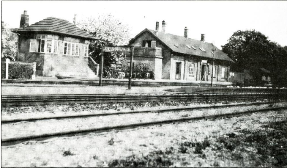
Kauslunde station med signalhuset til v. og dobbeltsporet foran.

Det skete forresten en gang til. Der kom en mand med en kassevogn med en kvashugger efter. Så sprang snoren og kvashuggeren blev stående på sporet. Han nåede at få den skubbet til side, inden toget kom, men jeg nåede ikke at få bommene lukket. Jeg vovede også denne gang at tie stille med det.