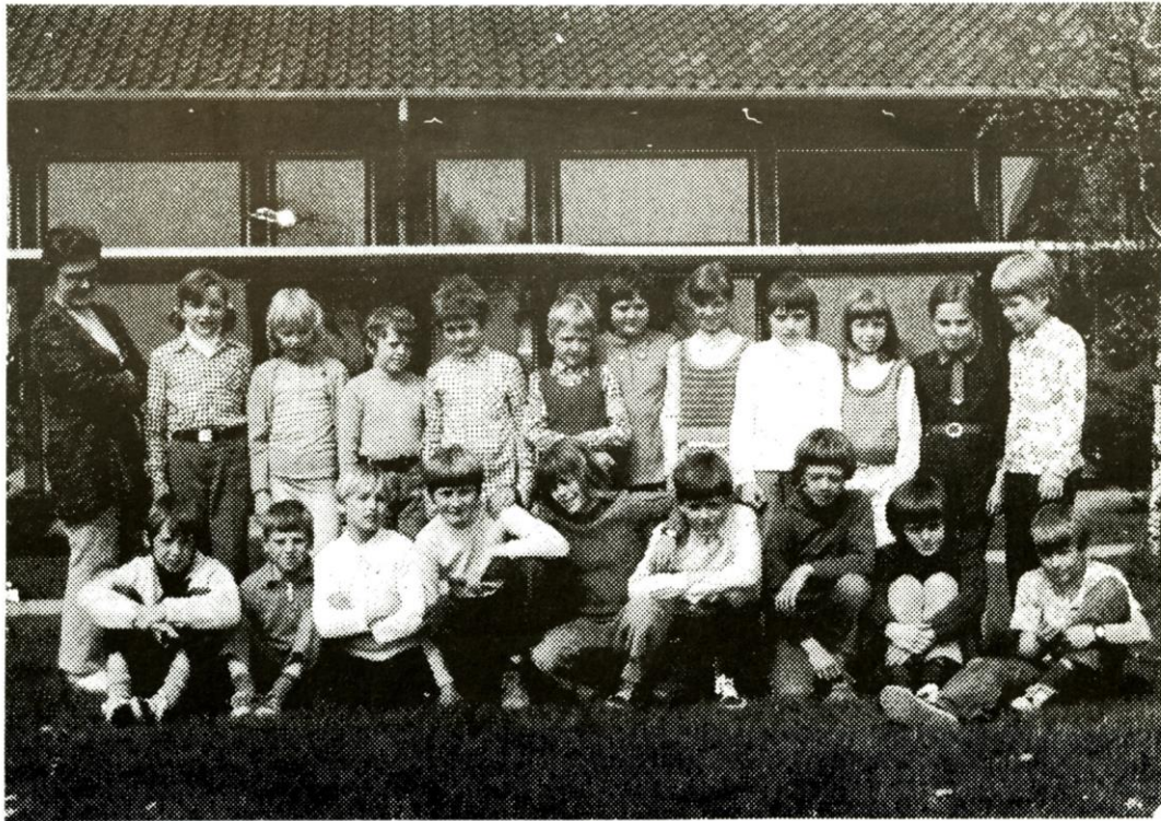
4. klasse 1970-71.

Der har altid været begejstring og stort engagement i arbejdet på Hyllehøjskolen. Nu arbejder man med henblik på virkeliggørelse af en ny skolelovgivning med stor indsats. Held og lykke med arbejdet!