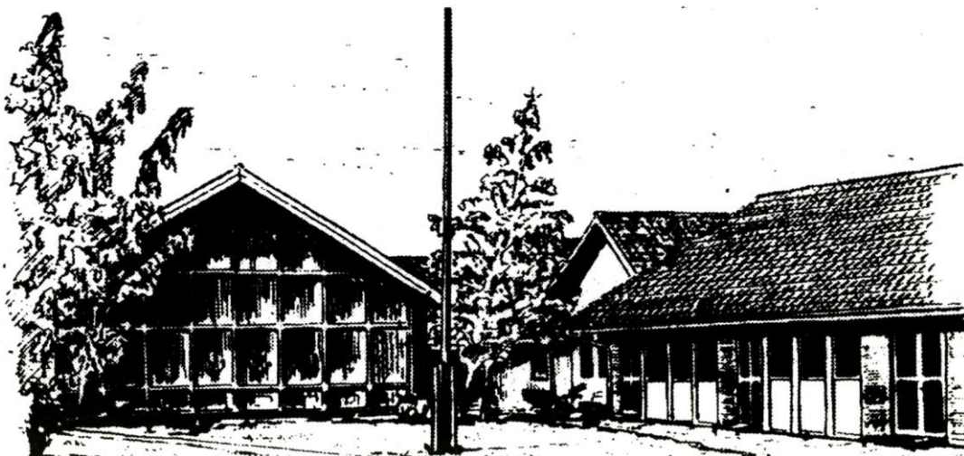
Hyllehøjskolen 1983. Tegning af John B. Larsen.

Der har altid været begejstring og stort engagement i arbejdet på Hyllehøjskolen. Nu arbejder man med henblik på virkeliggørelse af en ny skolelovgivning med stor indsats. Held og lykke med arbejdet!