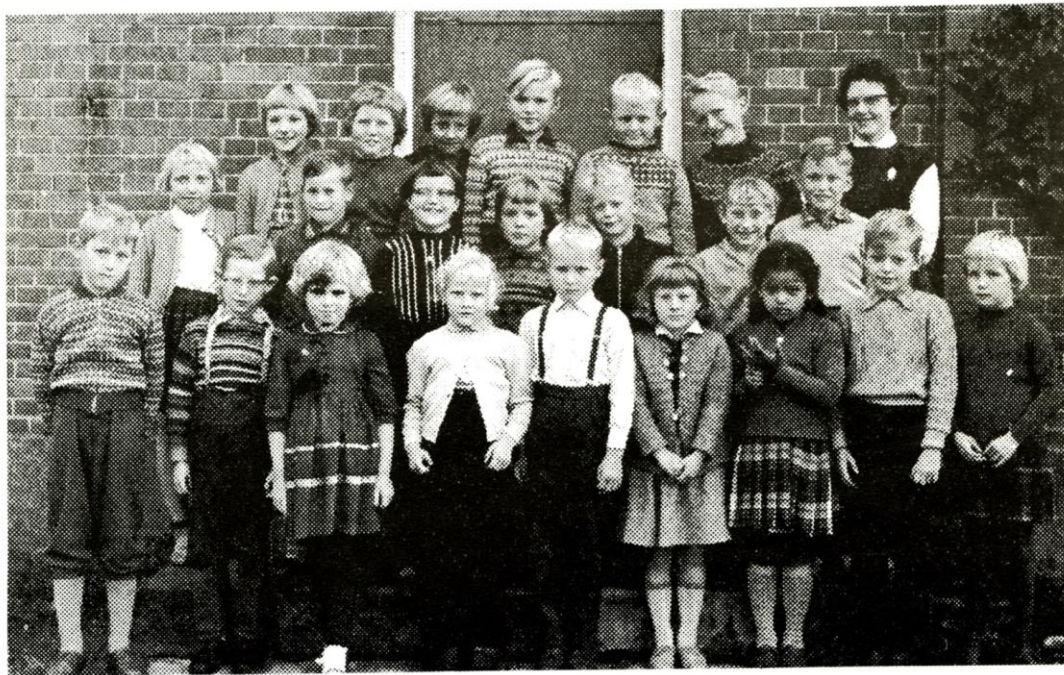
Forskolens elever, der fulgte med ud på Hyllehøjskolen 1962.

Mens byggeriet stod på, talte man ikke om andet end denne smukke skole, der skulle rejses på den lerede mark på Hyllehøj. Stedet var velvalgt. Midtpunktet for de tre skoleområder: Skrillinge, Kauslunde og Gamborg. Børnene glædede sig til at få nye skolekammerater, forældrene var forventningsfulde ved tanken om, at deres børn skulle få del i alt det nye og spændende. Vi lærere var noget benovede over, at alle vore ønsker om nye hjælpemidler og muligheder for børnene på alle måder, var ved at blive opfyldte.