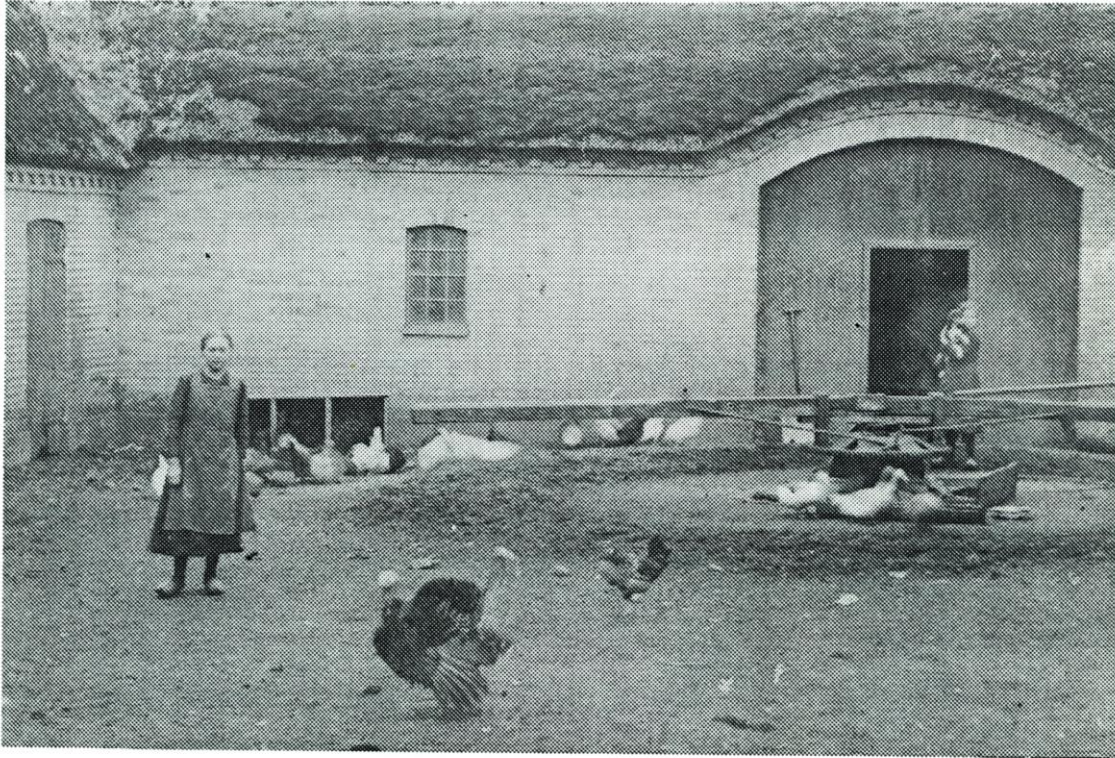
Gårdspladsen på Søgaard, 1918, bemærk hestegangen.

og til sidst skulle der være nogle lagt over kors i midten. Farfar havde også været soldat.